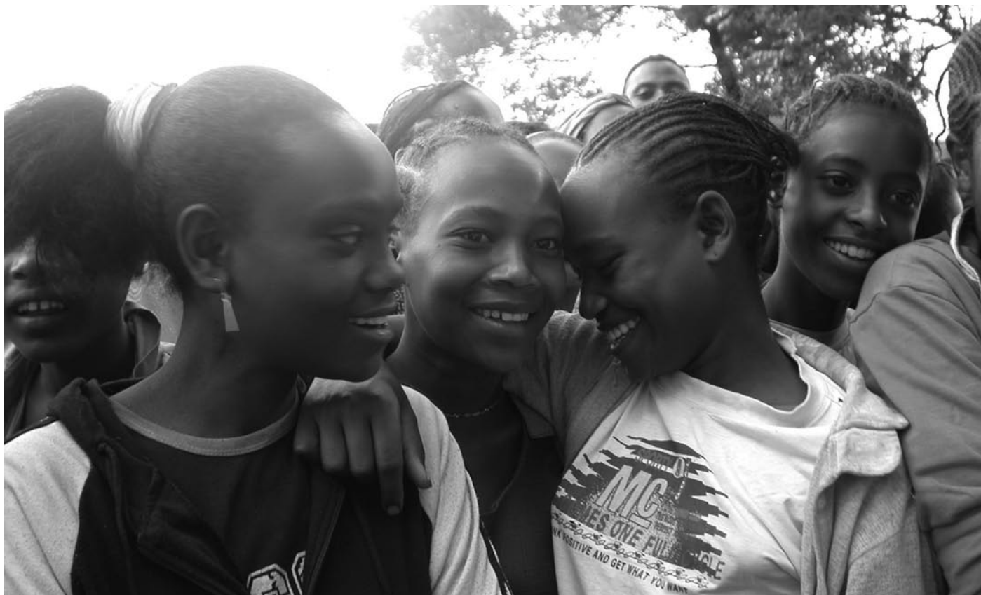
Duramen tyttöjen motto on nykyisin 'Olen kokonainen'.