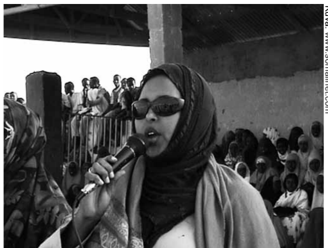
Puntinmaan naisten ja perheasioiden ministeri Asha Geelle toimi puheenjohtajana Somalinaisten vuosikokouksessa maaliskuussa 2011.

Kokous kesti kolme päivää (28.–30.3.2011). Ko-