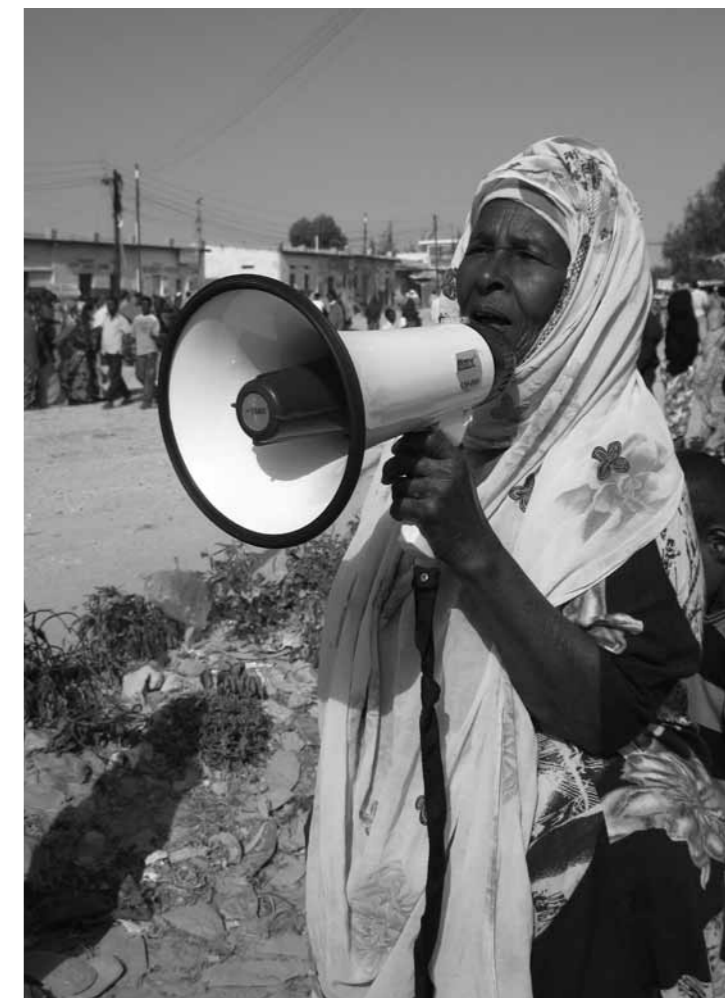
Vaalityöntekijä Hargeisassa 2010.