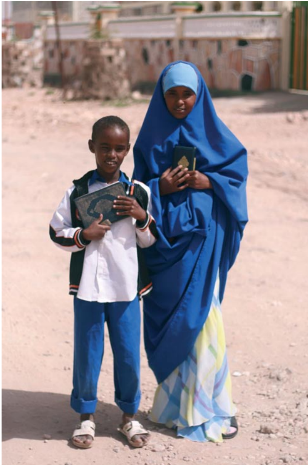
Koululaisia Hargeisassa, Somalimaassa 2008.