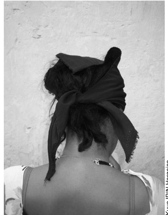
Kuva IRIN Hargeisa

Excerpt from Richard Burton, First Footsteps in East Africa, or An Exploration of Harar; 1894