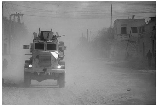
Kuwa IRIN Mogadishu

"Come out of my country you've spilled enough blood you have killed too many people you have caused a ton of trouble come out of my country... "