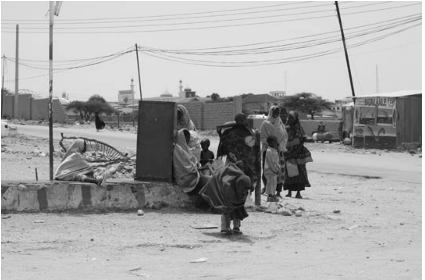
Kuva Naima Mohamud Hargeisa 2008